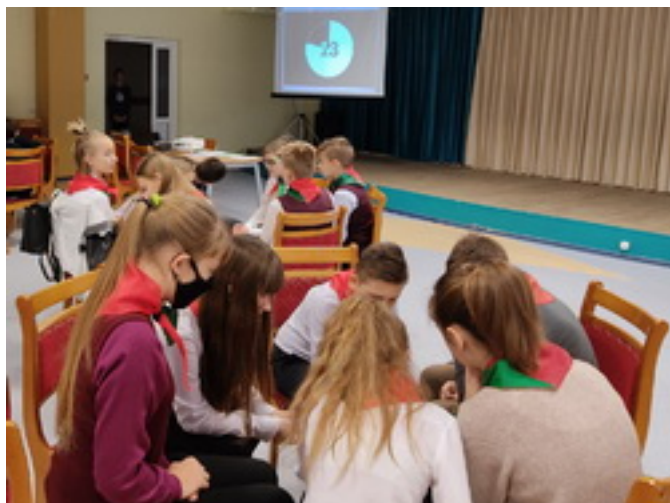
Итоги субботы □ (5 декабря 2020 г.) □