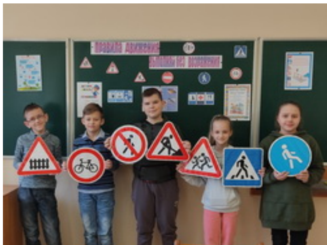
Итоги субботы □ (13 марта 2021г.) □