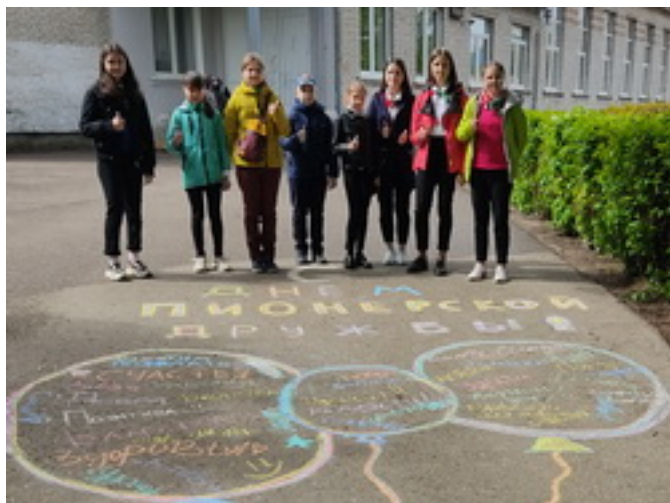
Итоги субботы □ (22 мая 2021г.) □