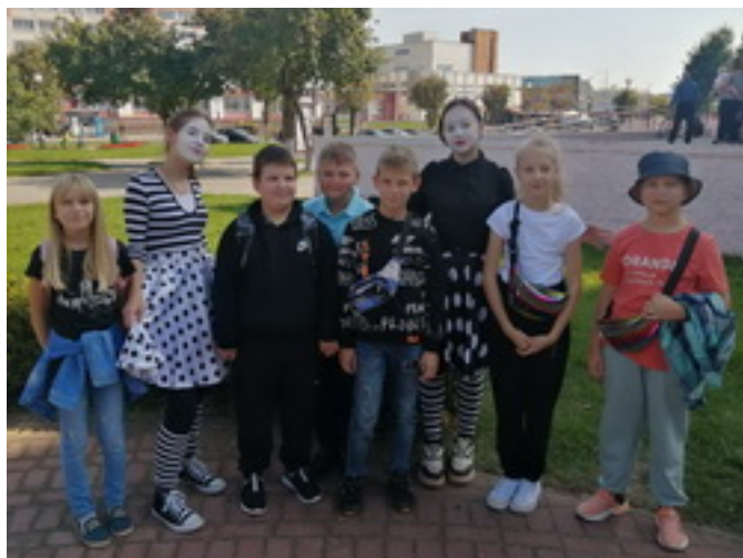
Итоги субботы □ (11 сентября 2021г.) □